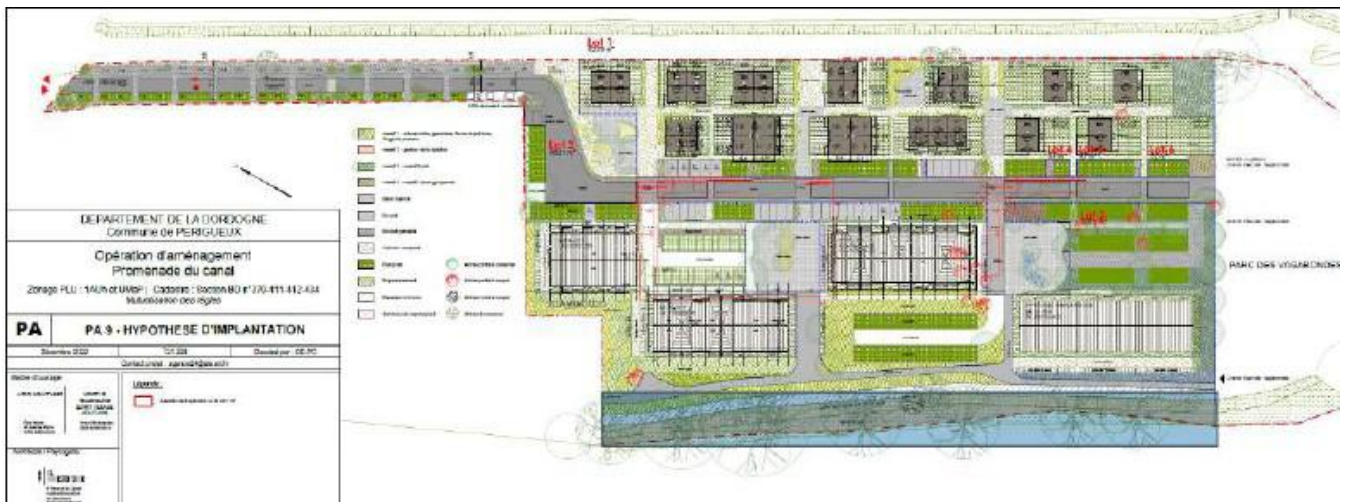
Plan du projet – Etude d'impact p. 22

L'accessibilité du site n'est possible que par deux ponts qui traversent le canal, au nord et au sud du site.